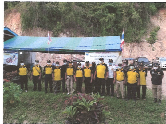
จุดที่ ๓ หน้าถ้ำพระขยางค์ หมู่ที่ ๕ ตำบลลำเลียง ปฏิบัติหน้าที่ : ระหว่างวันที่ ๓๐ ธันวาคม ๒๕๖๒ - วันที่ ๒ มกราคม ๒๕๖๓ (๐๖.๐๐ - ๑๘.๐๐ น.) จำนวนผู้ปฏิบัติหน้าที่ อปพร. ๗ นาย, กำนัน/ผู้ใหญ่บ้าน และชรบ. ๑๖ นาย จำนวนนักท่องเที่ยว : ๑๒๑ คน