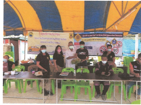
จุดที่ ๒ หน้าวัดลำเลียง หมู่ที่ ๑ ตำบลลำเลียง ปฏิบัติหน้าที่ ระหว่างวันที่ ๓๑ ธันวาคม ๒๕๖๓ - วันที่ ๒ มกราคม ๒๕๖๔ ๒๔ ชั่วโมง ๒ ผลัด จำนวนผู้ปฏิบัติหน้าที่ อปพร. ๒๐ นาย, กำนัน/ผู้ใหญ่บ้าน และชรบ. ๕๒ นาย